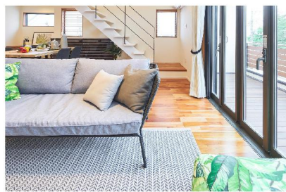
あざみ野新築戸建て物件