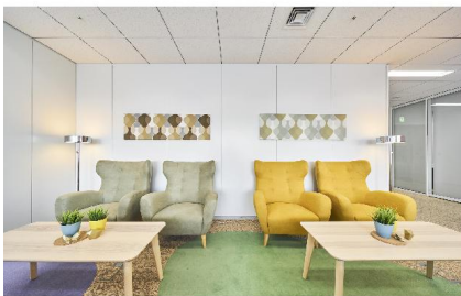
NTTデータ オフィス休憩室