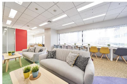
NTTデータ オフィス休憩室